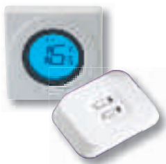
Thermostat électronique simple RF série S