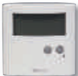
Thermostat ERT30 digital plancher chauffant RF