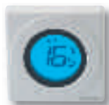
Thermostat électronique hebdo série S