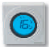
Thermostat électronique simple série S