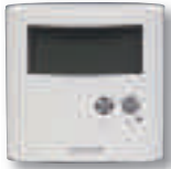
Thermostat ERT30 digital plancher chauffant 24V