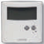
Thermostat ERT30 digital plancher chauffant 220V