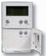
Thermostat ERT50 programmable plancher chauffant RF