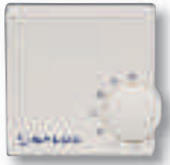
Thermostat RT électronique plancher chauffant 24v