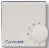
Thermostat RT électronique plancher chauffant 220v