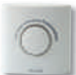
Thermostat ERT20 électronique plancher chauffant 220v