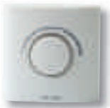
Thermostat ERT20 électronique plancher chauffant 24v