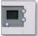
Thermostat digital simple