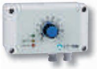
Thermostat proportionnel étanche