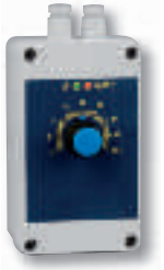
Thermostat étanche -5 / +35°C