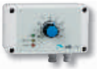
Thermostat proportionnel étanche chaud/froid